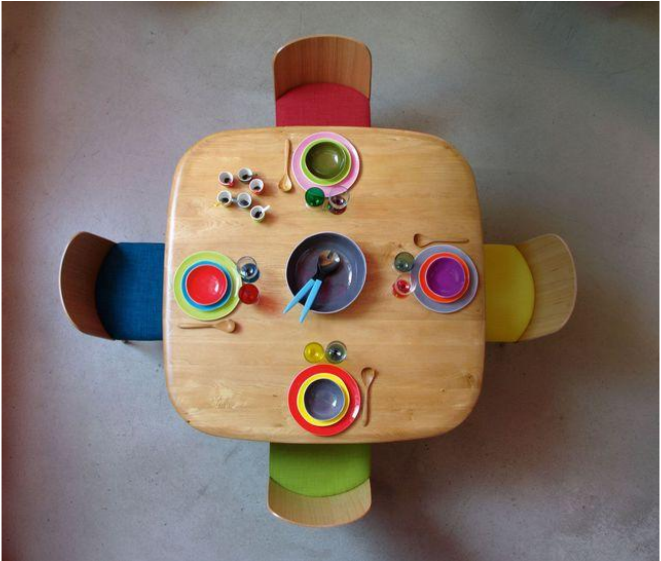
Table "Emma", chaises "Isabelle", arts de la table Brigitte de Bazelaire.