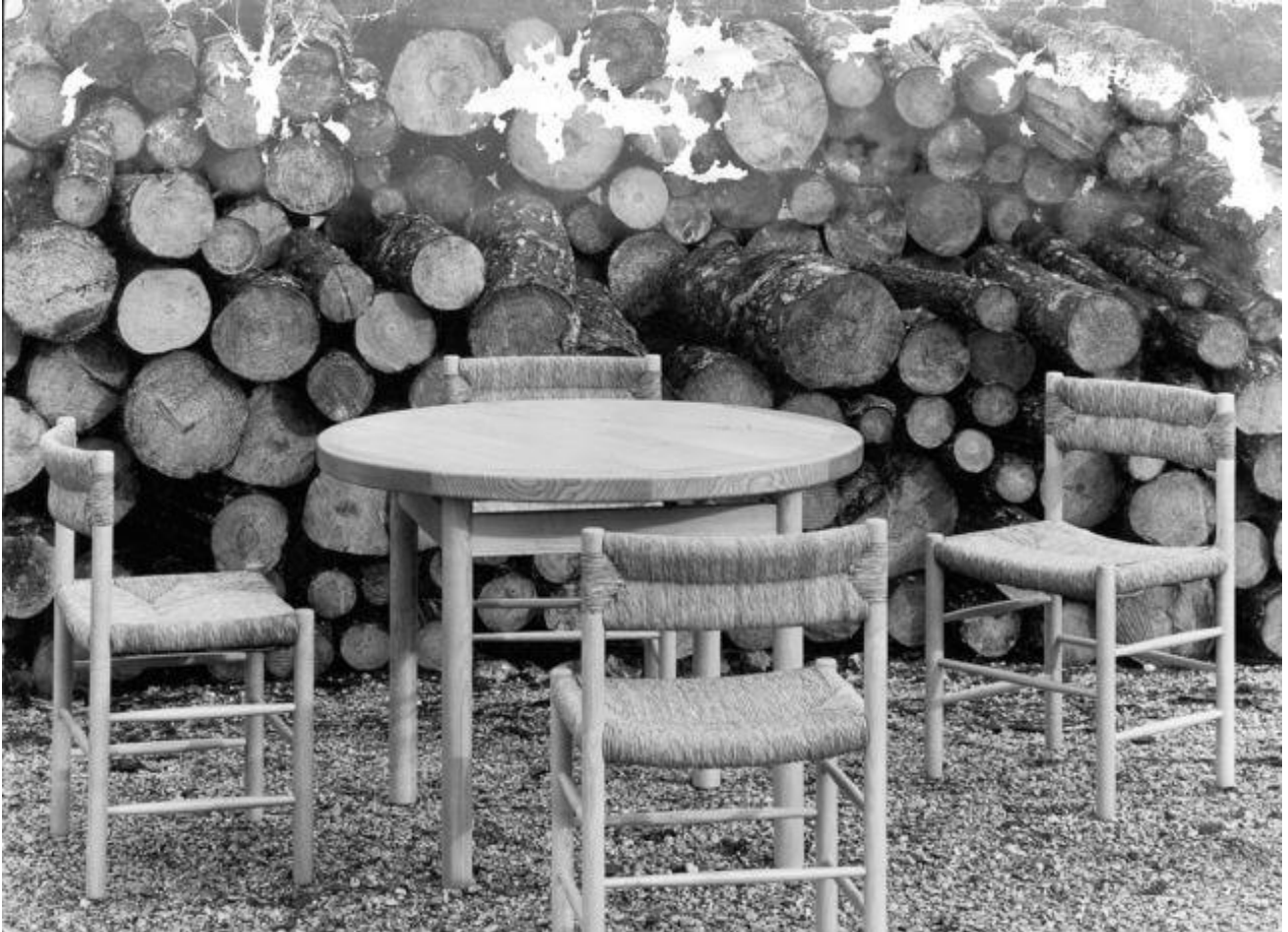
Les chaises paillées, dans les années 1950.