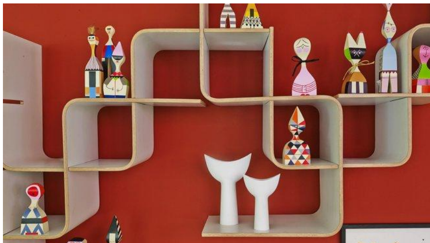
Afficher la galerie

Dans la boutique de Sentou, boulevard Raspail, étagères modulaires 66 de Marc Held en multiplis de hêtre moulé et stratifié blanc qui permettent une infinité de combinaisons et d'assemblages. Création en 1966 et réédition Sentou. Créées en 1953 par Alexandre Girard, les Wooden Dolls, des poupées en sapin massif peint à la main.